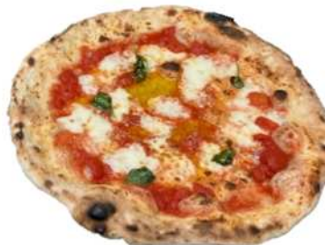
ピッツァ マルゲリータ

「価値ある本物のおいしさ」をコンセプトにバイヤーが商品開発。本場ナポリ地方でとれた小麦を使用した「本格ナポリピッツァ」や、地元青森の食材（サーモン・ほたて）を使用した「これぞ青森のはらこ飯」等を販売します。