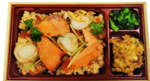
これぞ青森のはらこ飯