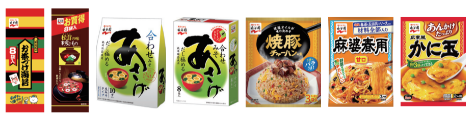
※画像はすべてイメージです。

※キャンペーン対象商品一例です。 店舗によって一部取扱いのない商品もございます。