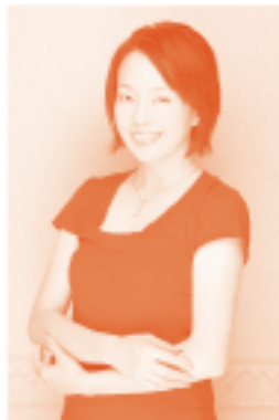
ゲストランナー 千葉 真子さん

小学生に楽しく走ることの 素晴らしさを体感してもらい、 心とからだの健康づくりに 貢献するための大会です。